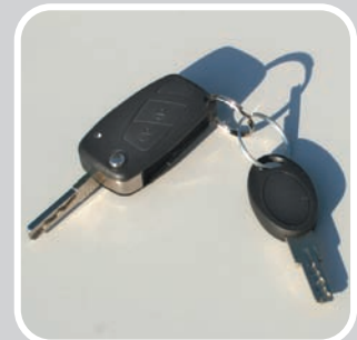
Zentralverriegelung mit Funkfernbedienung