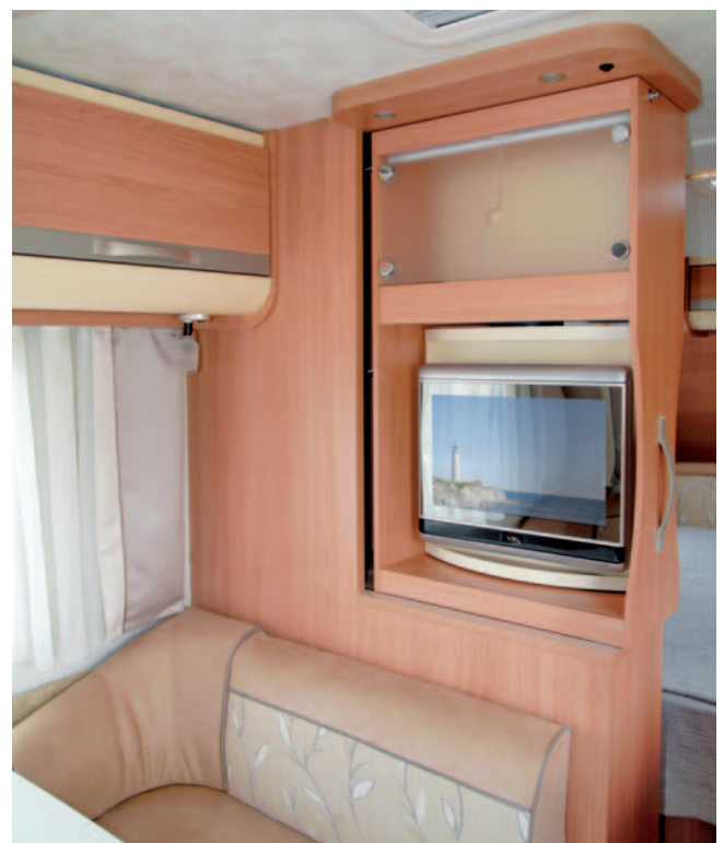
■ Ausgezogen ist der Fernseher sichtbar, dreht man ihn auf die andere Seite, kann der Krimi vom Bett aus verfolgt werden.