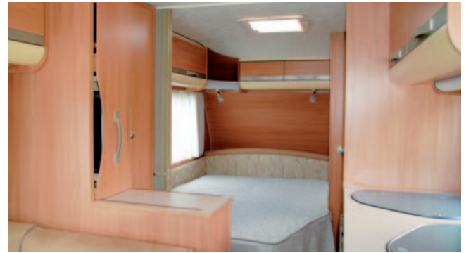
■ Das Bugschlafzimmer kann per Faltwand separiert werden. Der Vitrinenauszug links trennt und hat Platz für den Fernseher.

santen Grundriss wie geschaffen für das alleinreisende Paar, das zuweilen seine beiden Enkel mit auf Reisen nimmt. Für einen längeren Aufenthalt zu zweit ist er bestens geeignet, kürzere Zeit zu viert ist trotz kleinem Innenraum möglich. Adria-geohnt gut verarbeitet ist der Adora sowohl im Aufbau als auch der Inneneinrichtung. Der 462 PS hat im Bug ein ausreichend großes Doppelbett neben dem Toilettenraum und dem ausgelagerten Waschtisch mit großem Stauraumangebot. Unmittelbar an das Bett grenzt ein kleines Sideboard, das in seinem Oberteil die auszieh- und um die eigene Achse drehbare Vitrine mit rückseitigem Fernsehfach verbirgt. So kann so-