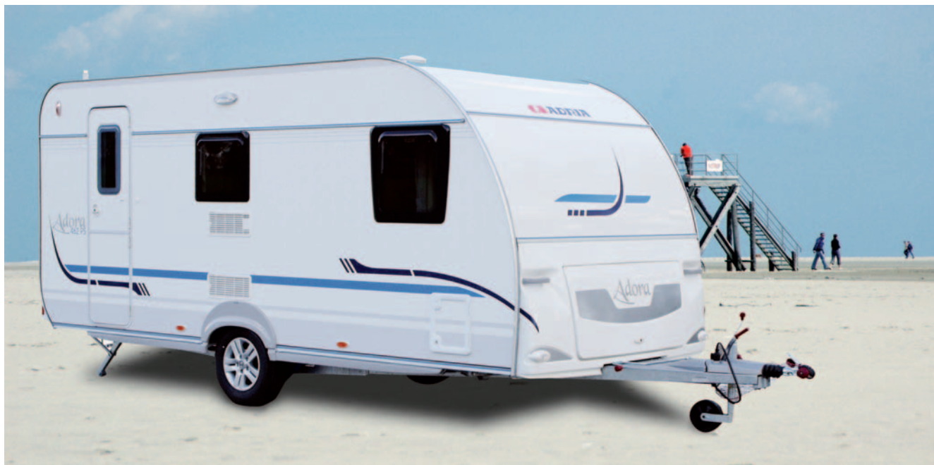
■ Die schwarzen Scheiben sind eines der Hauptmerkmale des neuen Adria-Designs