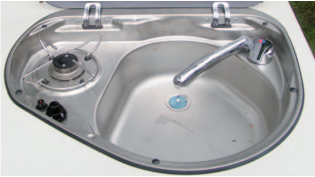
■ Eine Spezialität von Adria: Der in die Spüle integrierte Einflammenkocher schafft Arbeitsplatz und ergänzt nach Bedarf den Zweiflammkocher daneben.