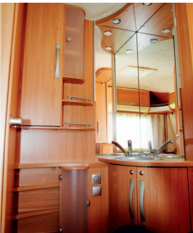
■ Praktisch und schick: Der offene Waschbereich im Schlafzimmer.